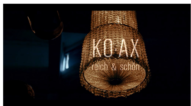
Live Recording Sessions aus dem Treibhaus Innsbruck (2022)