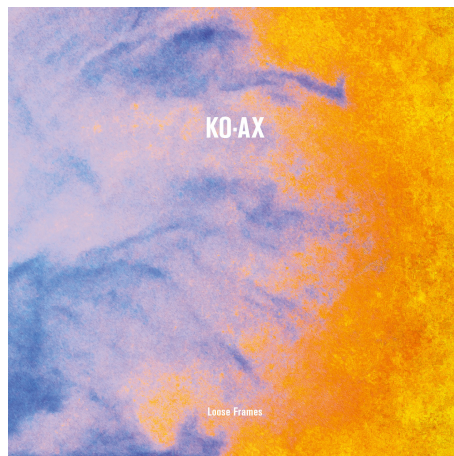
Album „Loose Frames“ (2017, Freifeld Tonträger)